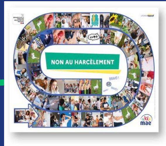
Jeu de l'oie

« Main dans la main contre le harcèlement »